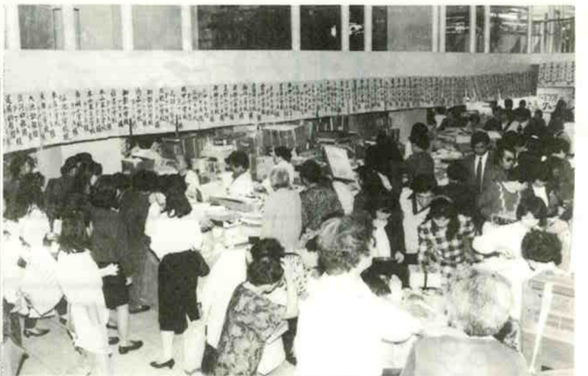
バザー会場には、協力者の名前が貼られて……